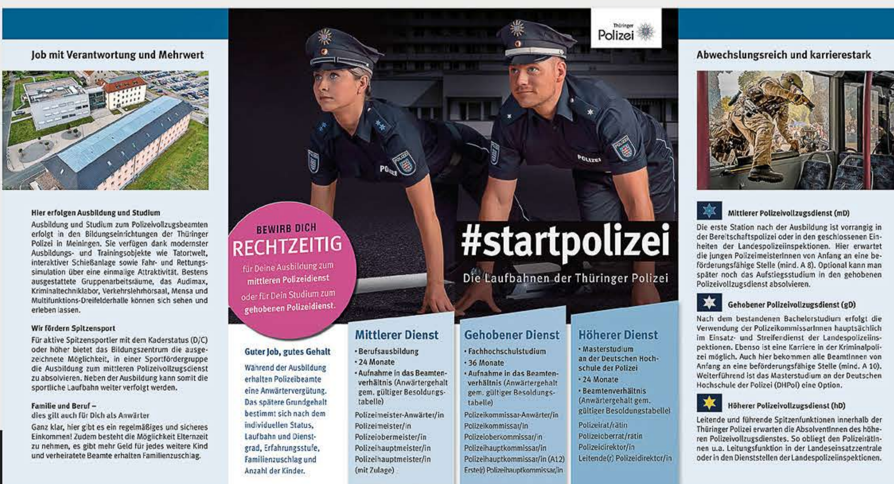
Flyer-Innenseite 100 x 210mm