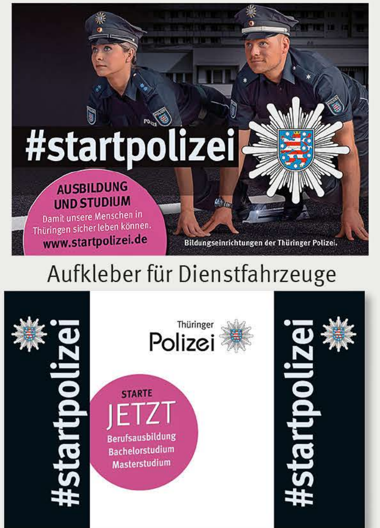
Aufkleber für Dienstfahrzeuge