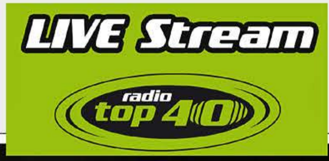
-- Radiowerbung, Verkehrssponsoring/Blitzermeldung :)