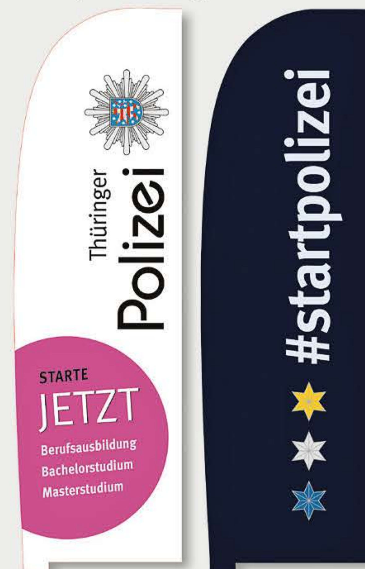
Bowflags für PR-Arbeit