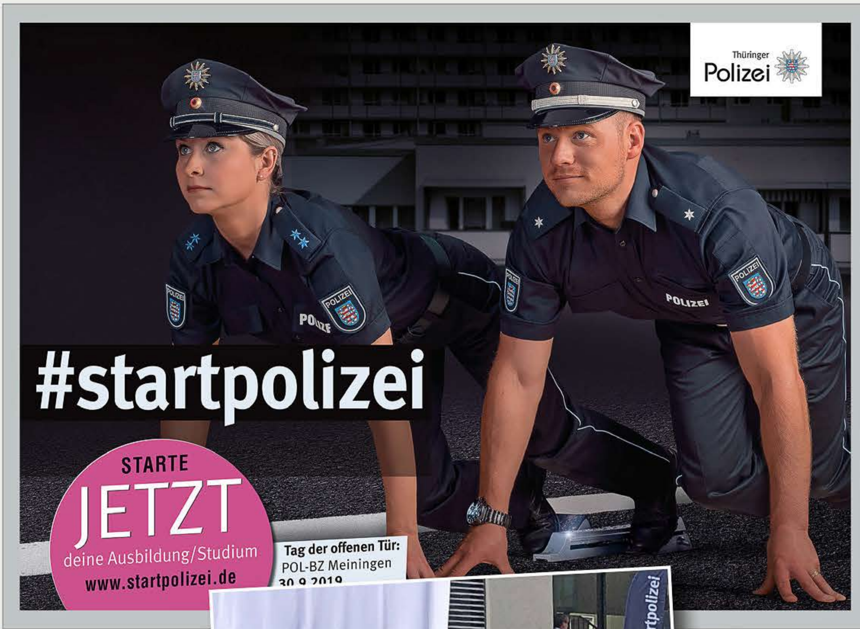
CityStars und -->