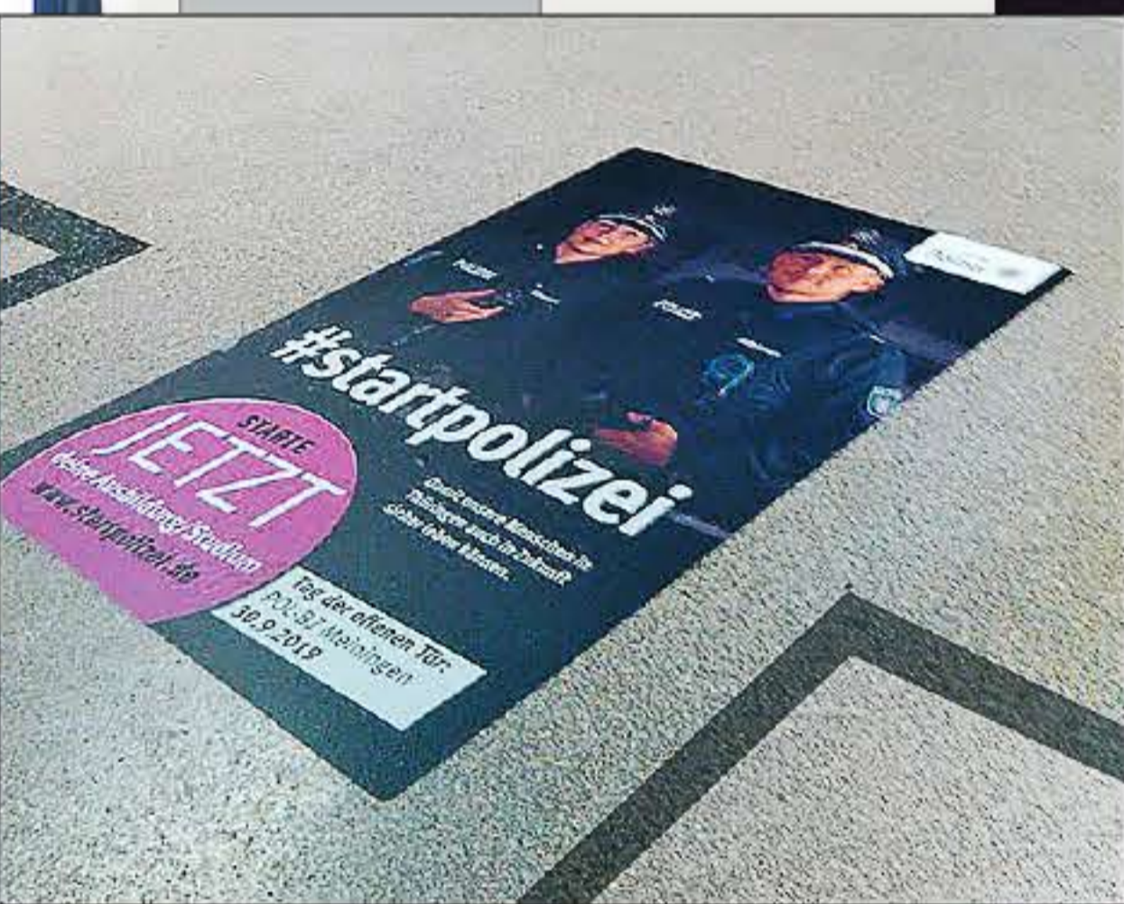
Groundposter auf Bahnhöfen