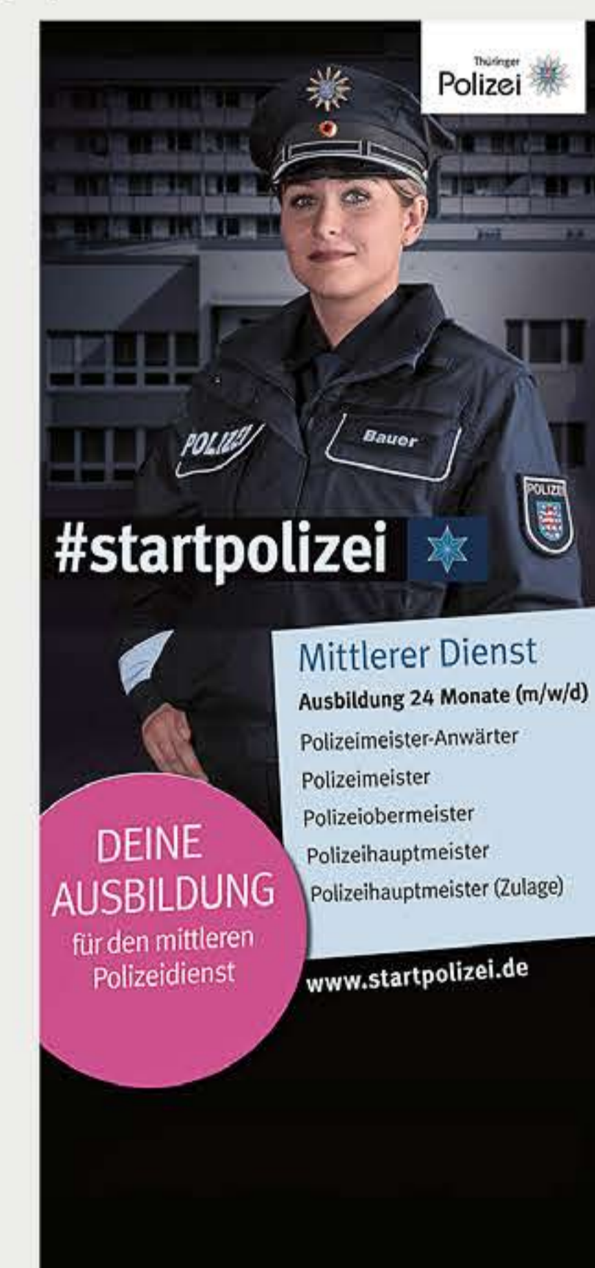
Rollups für PR-Arbeit