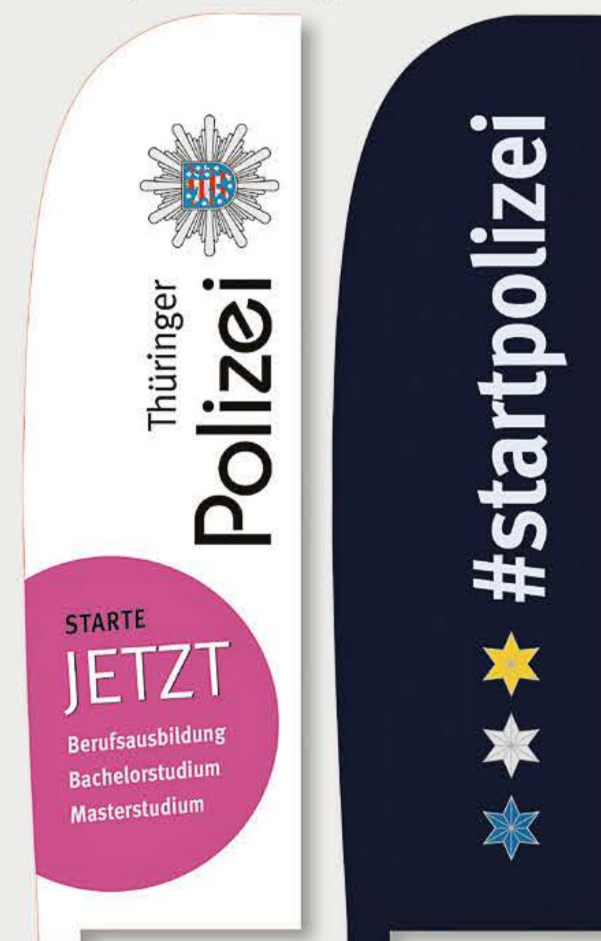
Bowflags für PR-Arbeit